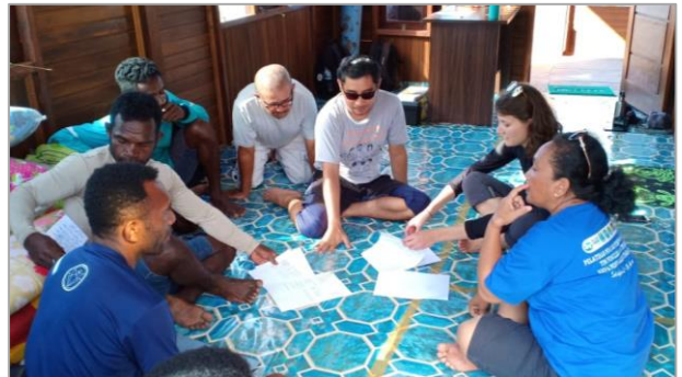
Berdiskusi dengan Tim Patroli YNP di Pos Misool Utara

review administrasi keuangan terkait kegiatan patroli.