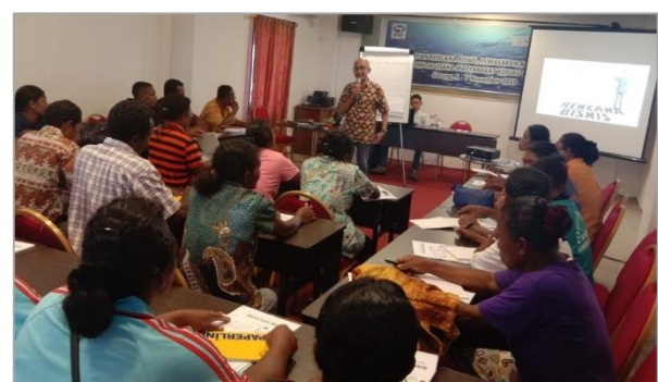
Narasumber dan peserta Pelatihan Rencana Usaha

Dalam rangkaian pelaksanaan program Produksi dan Pemasaran Ikan Asin Khas Kofiau, Kelompok Nelayan Maido Fa Kofiau melaksanakan Pelatihan Rencana Bisnis, Pemasaran dan Keuangan pada tanggal 4-7 November 2019 di Sorong, Pelatihan ini bertujuan untuk memberikan pengetahuan dan pemahaman kepada kelompok usaha masyarakat di Kofiau dan Misool khususnya untuk Kelompok Nelayan Maido Fa.