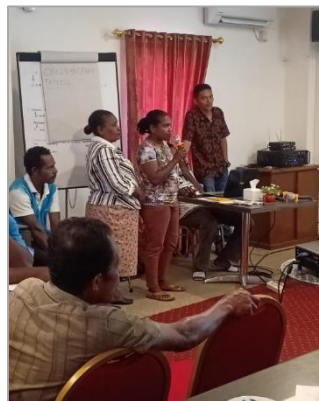
Kelompok Nelayan Maido Fa, Kelompok Sasi Kapatcol dan Badan Usaha Milik Desa (BUMD) Deer sedang mempresentasikan dokumen rencana bisnisnya

Setelah menerima materi teori perencanaan & keuangan usaha, peserta pelatihan dibagi dalam kelompok dimana tiap kelompok diberikan kesempatan untuk menyusun rencana usaha kelompok serta mempresentasikannya kepada seluruh peserta pelatihan.