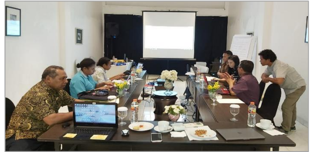
Pelatihan Software Akuntansi untuk UPTD BLUD KKP Kep. Raja Ampat

triwulanan keuangan BLUD yang disampaikan ke Dinas Kelautan dan Perikanan Prov. Papua Barat.